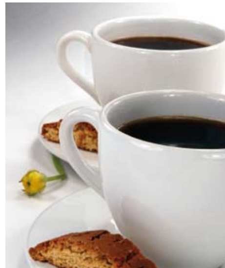
■ Der Kaffeepreis ist ein regelrechtes Politikum.

pitalzinsen, die Mehrwertsteuer und anderes mehr sind noch gar nicht berücksichtigt. Und last but not least muss der Wirt auch einen Gewinn erzielen, wenn er langfristig überleben will.