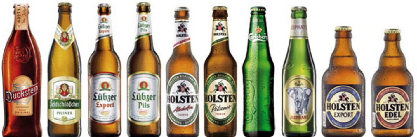
Der Grossteil der Bussgeldsumme von 231.2 Millionen Euro entfällt auf die Radeberger-Gruppe und die deutsche Tochter von Carlsberg.

Ausserdem spielt der sogenannte kartellbefangene Umsatz, also der Umsatz mit den Produkten, die tatsächlich Gegenstand der Absprache waren, eine wichtige Rolle. Das Bundeskartellamt machte keine Angaben zu den jeweils im Einzelnen verhängten Bussen.