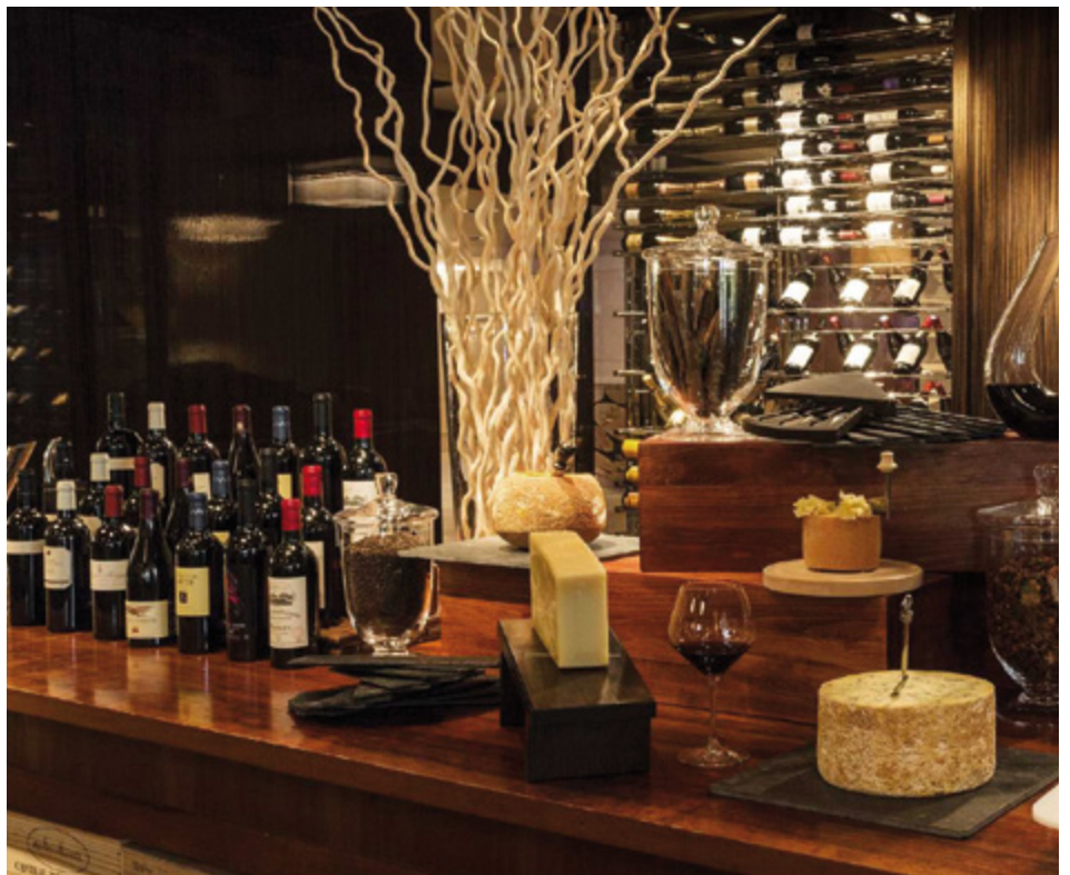
Der Freihandel beim Wein und Käse zeigt, dass eine Öffnung der Märkte funktioniert: Qualität, Vielfalt und Exporte haben zugenommen.

Es braucht faire Begleitmassnahmen, damit die Ernährungswirtschaft den Übergang in offenere Märkte gut bewerkstelligen und die Marktanteile halten kann. Agrarpolitik und Handelspolitik enger müssen enger koordiniert werden.