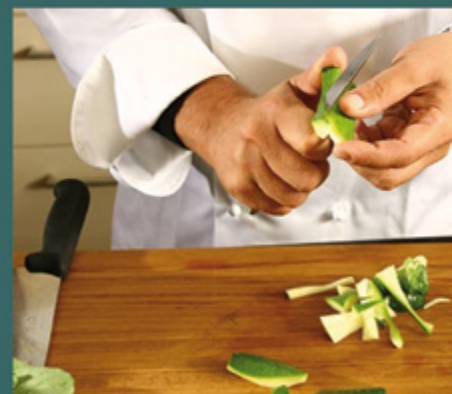
Stellenangebote und Stellengesuche