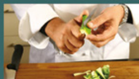
Stellenangebote und Stellengesuche