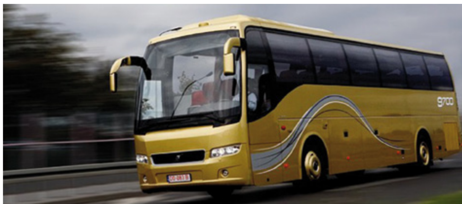
Reisebusse sind bei Städtetouristen beliebt, da mit ihnen die Ziele sehr direkt angefahren werden können.

Verschiedene Studien belegen, dass der Bustourismus hervorragende Möglichkeiten bietet, touristische Anlaufpunkte zu vermarkten. Städte können durch gezielte Massnahmen viel zur Optimierung eines busfreundlichen Tourismus beitragen. Busreisende geben entgegen einem verbreiteten Vorurteil viel Geld aus. Sie schaffen und sichern damit Arbeitsplätze im ortsansässigen Gewerbe.